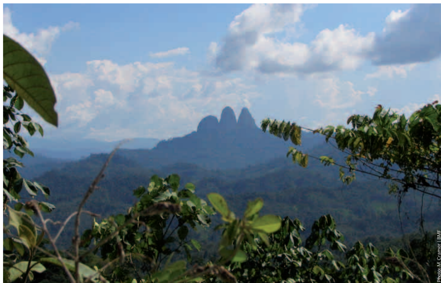
Ancienne forêts pluviales à Bornéo.

Que peut faire le monde politique, en Suisse, pour la conservation des forêts anciennes? Le principe à appliquer est: «penser globalement, agir localement». Concrètement, cela signifie que lors de leurs achats de bois et de papier, les administrations et les entreprises des communes, des cantons et de la Confédération choisissent systématiquement des produits durables ménageant les forêts anciennes. Ainsi, elles montrent l'exemple aux ménages privés et influencent le marché en encourageant une gestion durable des forêts et de leurs ressources. Au plan politique, le bilan actuel est mitigé. Certes, l'idée même du respect des forêts anciennes est de plus en plus répandue et plusieurs exemples d'actions concrètes sont tout à fait positifs. Mais le thème ne soulève pas un grand intérêt et la mise en œuvre fait souvent défaut. Foretsanciennes.ch continuera de s'engager pour que les institutions politiques suisses se montrent plus respectueuses.